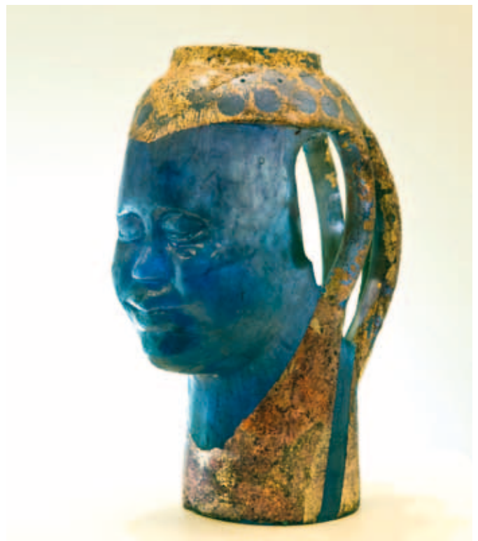
Rechts: Richard Price, Chinese Girl , 2010; gesmolten glas, verloren was methode; h 33 cm.