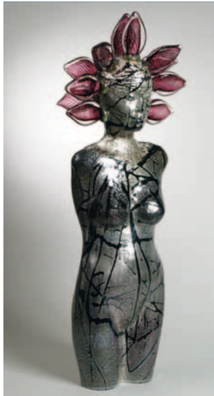
Richard Price, Flower Lady , 2005; in de mal geblazen glas; h 105 cm.