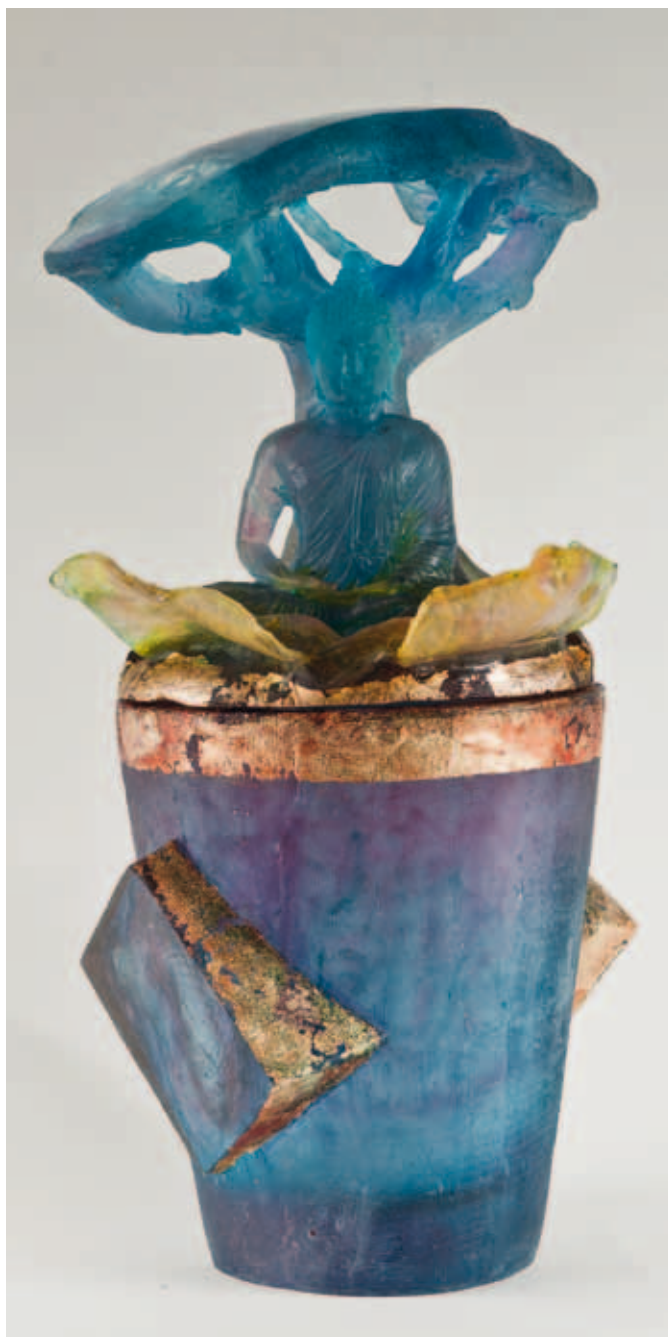
Richard Price, Flower Buddha , 2011; gesmolten glas, verloren was methode; h 45 cm.