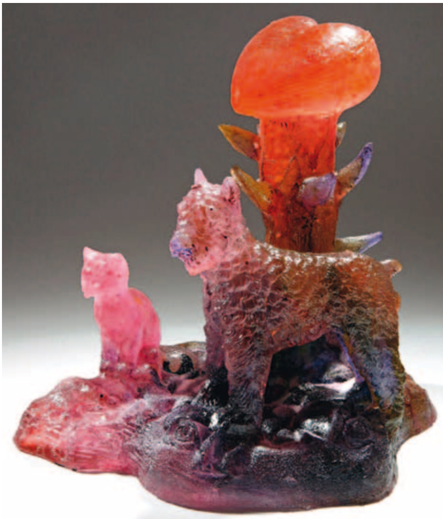
Richard Price, Good Friends , 2010; gesmolten glas, verloren was methode; h 26 cm.