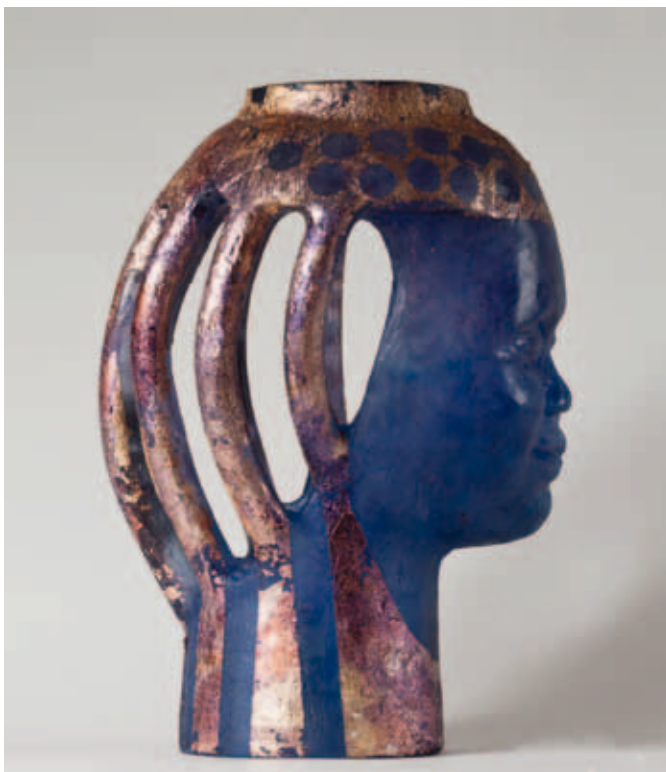
Richard Price, Chinese Girl , 2011; gesmolten glas, verloren was methode; h 35 cm.

"Zijn boeddhistische inslag oefent op subtiele wijze invloed uit op zijn creatieve visie. Het sterke geloof in de illusie van vrijheid brengt met zich mee dat de lichaamsvormen van zijn beelden er uitzien alsof ze een zekere schwinging hebben, terwijl ze opgesloten zijn tussen glazen tralies of letterlijk geketend zijn", schrijft Grant Price. "Het is onmogelijk om te ontsnappen, maar ze willen dat ook niet. Dit zijn gevoelens die wij als mensen regelmatig in ons eigen leven ervaren."